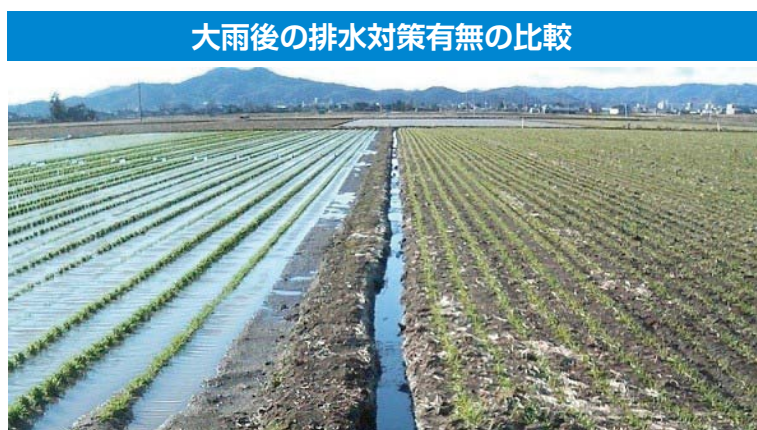
大雨後の排水対策有無の比較 左圃場：排水対策無し、右圃場：排水対策有り (明渠+心土破碎)