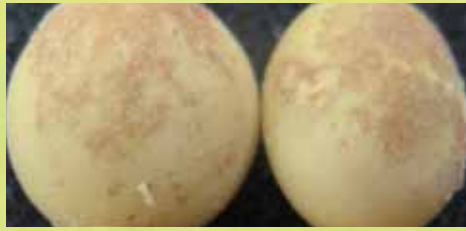
べと病(子実)